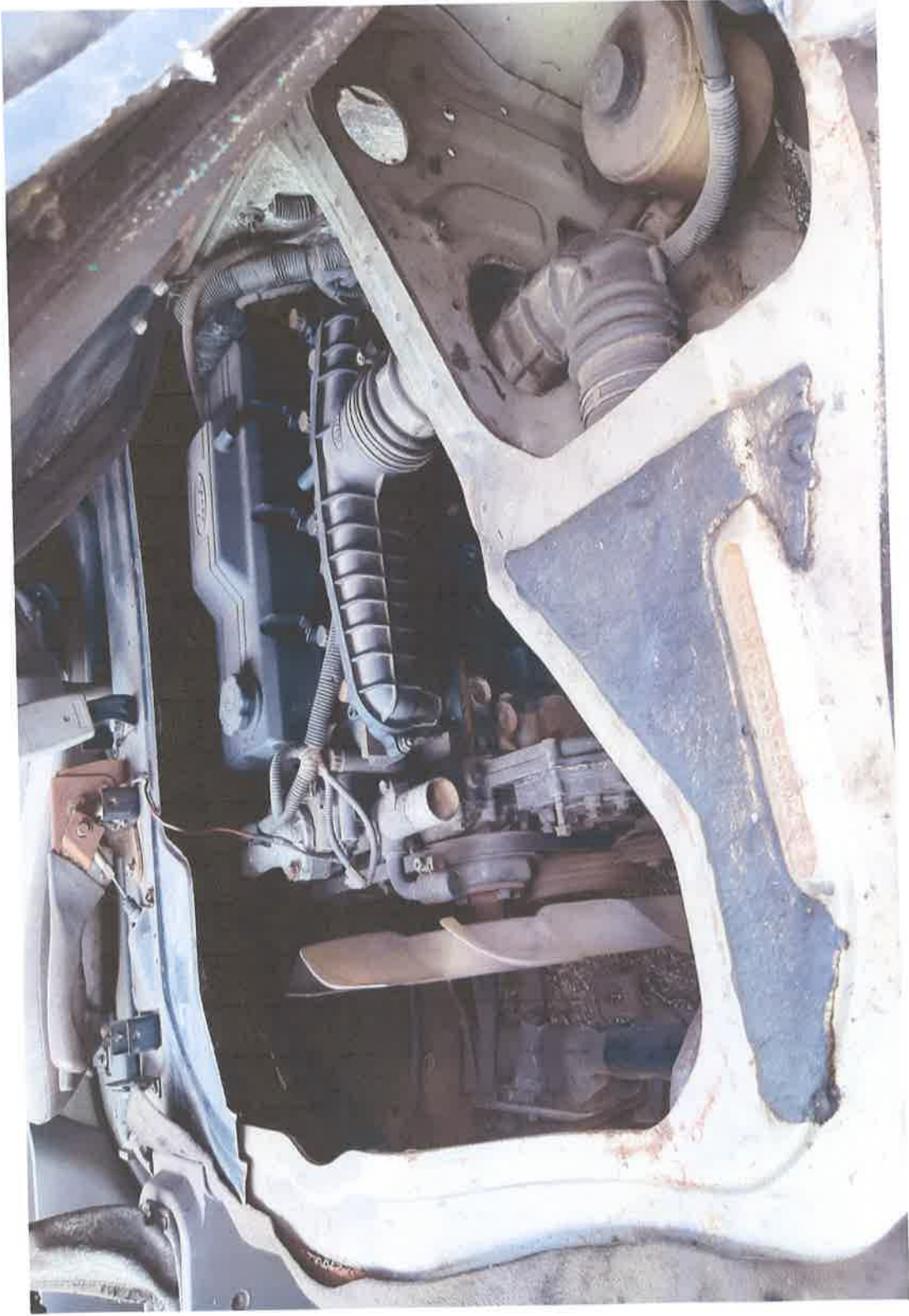
Pandangan Dalam - Bagian Enjin Kenderaan