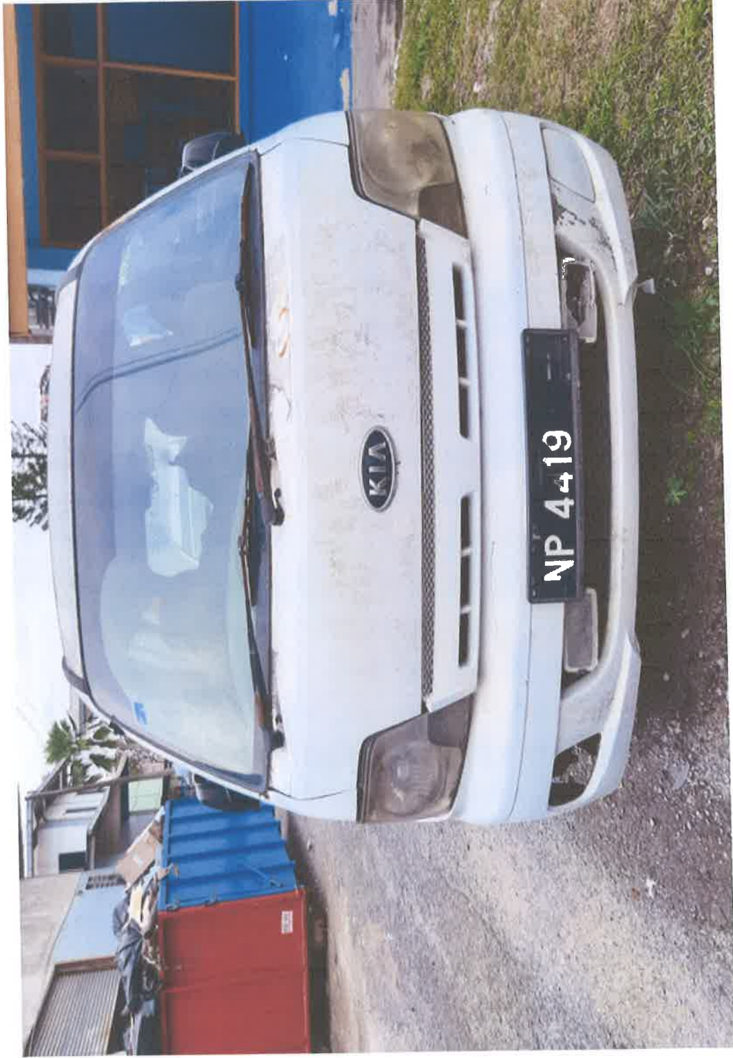
Pandangan Hadapan Kendaraan