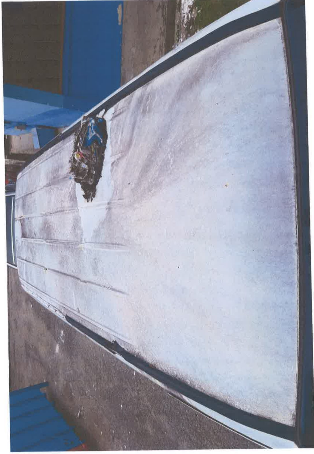
Pandangan Atas- Bahagian Bumbung Kenderaan