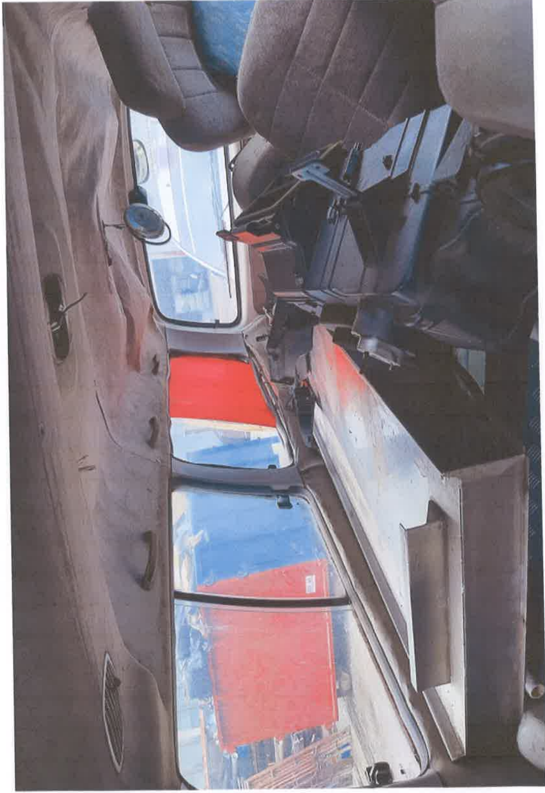
Pandangan Dalam - Bagian Dalam Belakang