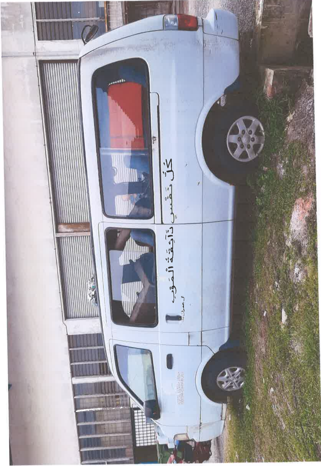
Pandangan Sisi Kiri Kendaraan