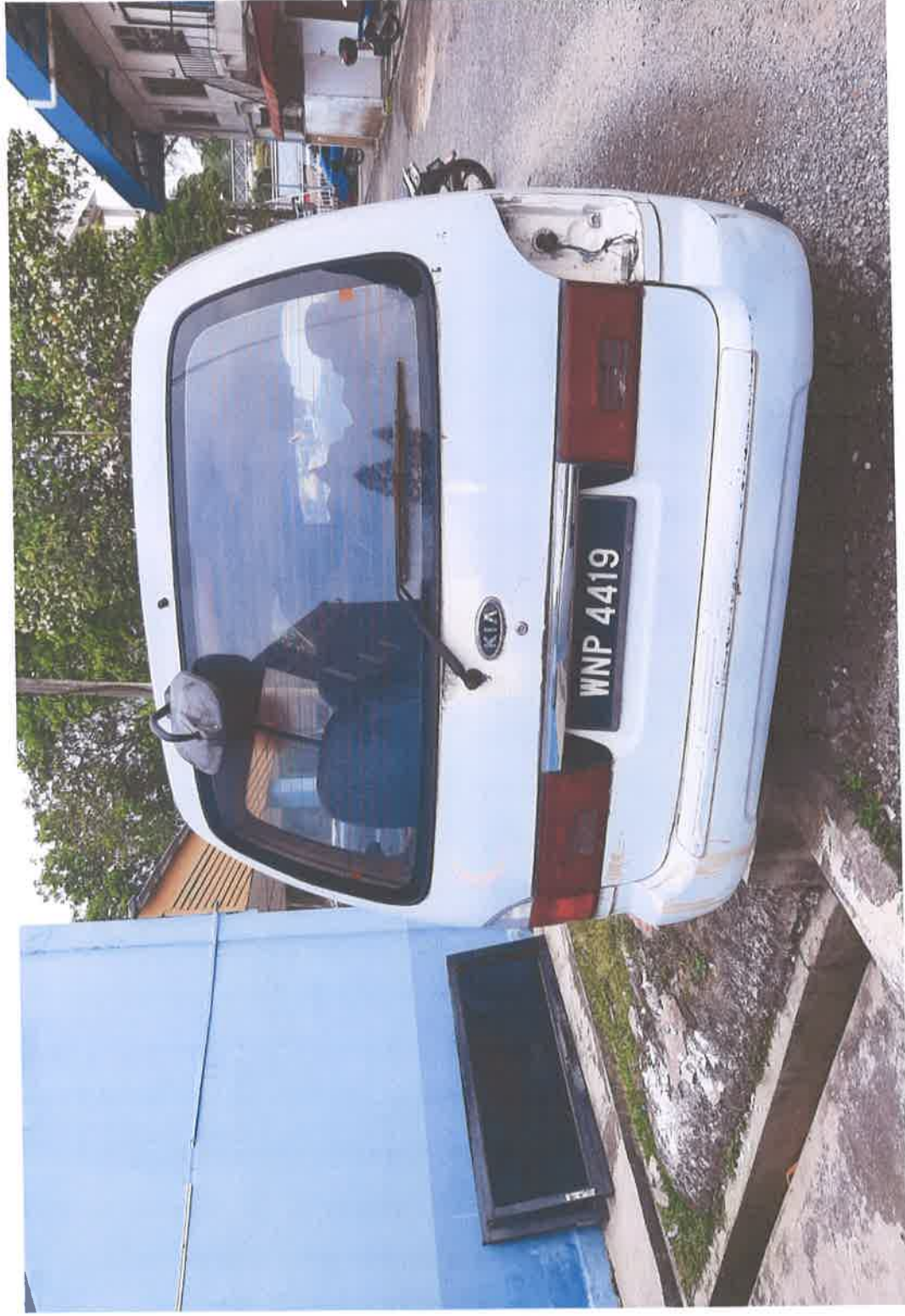
Pandangan Belakang Kendaraan