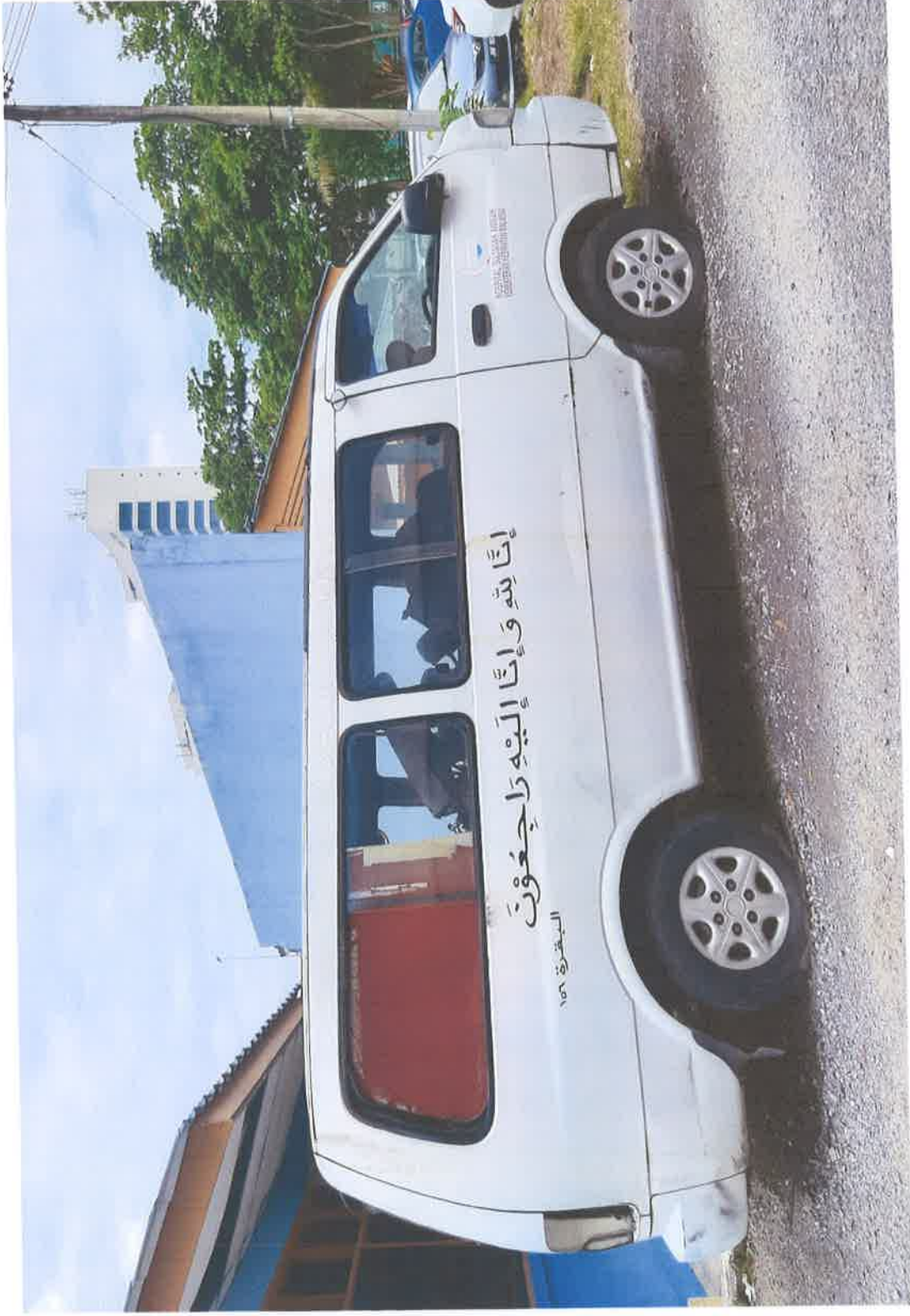
Pandangan Sisi Kanan Kendaraan