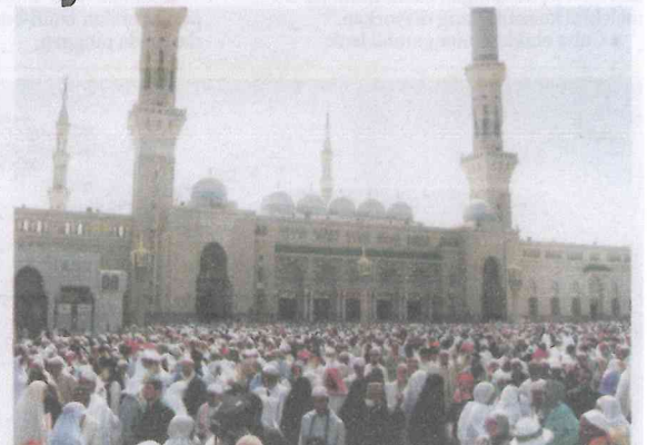
LAUTAN jemaah membanjiri Masjid Nabawi di Madinah iaitu salah satu masjid yang menjadi tumpuan umat Islam dari seluruh dunia. — Gambar hiasan

Sebahagian individu yang terdedah kepada bakteria itu akan mendapat penyakit manakala sebahagian lagi menjadi pembawa bakteria