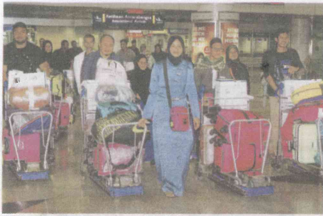
JEMAAH haji dan umrah perlu mengambil suntikan vaksin sekurang-kurangnya 10 hari sebelum tiba di Tanah Suci. — Gambar hiasan

AKHBAR : KOSMO MUKA SURAT : 36 RUANGAN : PESONA