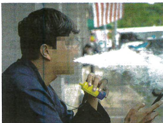
KOS rawatan penyakit kecederaan paru-paru berkaitan rokok elektronik menelan belanja yang besar.

kementerian akan mengehendakan vape supaya tidak mempunyai pembungkusan dan perisa yang menarik.