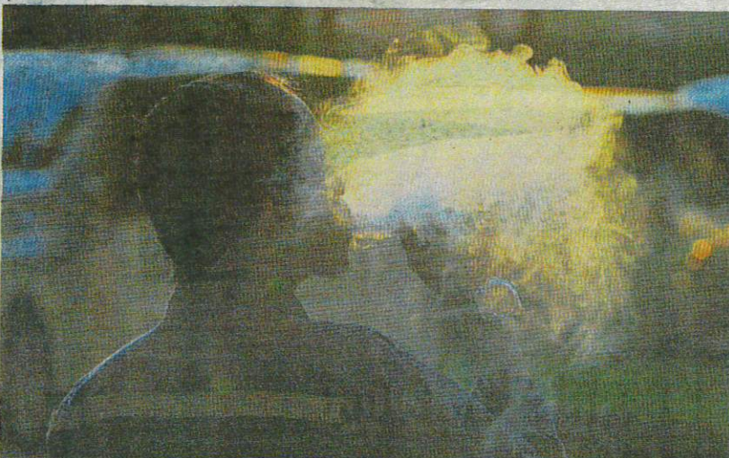
A total of 18 e-cigarette or vaping use-associated lung injury cases have been reported since last year. FILE PIC

Several non-governmental organisations, including the Consumers Association of Penang, had also urged the government to expedite the tabling of the bill, which covers regulation on e-cigarettes and vapes, as well as tougher controls on the use of tobacco. Additional reporting by Nuradzimmah Daim.