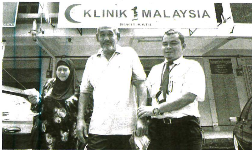
KERAJAAN perlu mewujudkan Klinik Rahmah atau Klinik Madani sama seperti konsep Klinik 1Malaysia yang pernah wujud sebelum ini.

Sayugia diingat, pakar perubatan bukan sahaja