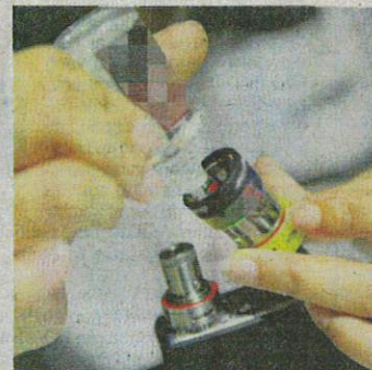
Penggunaan bahan cecair yang dilarang menyebabkan pengguna vape berdepan risiko kerosakan paru-paru.

fungsi bagi mengubati ketagihan merokok. Ia sesuai bagi perokok tegar yang sukar diubati ketagihannya.