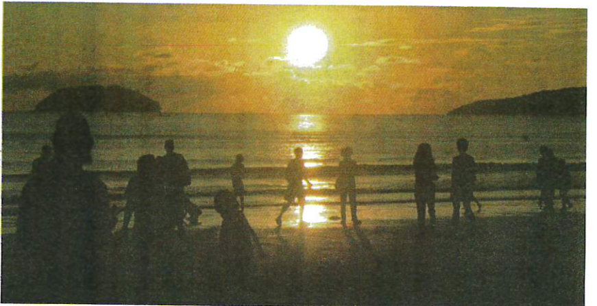
PEMANDANGAN indah sebelum matahari terbenam dirakam di Pantai Tanjung Aru, Kota Kinabalu, Sabah.

“ Kita terperangkap dalam perlumbaan untuk menjadi lebih baik ” Sumber