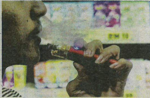
Ketagihan vape boleh menyebabkan kebocoran pada paru-paru dan berisiko tinggi membawa maut.

kerajaan menyatakan langkah untuk memastikan keselamatan vape serta kesan baik dan buruk penggunaan peranti tersebut.